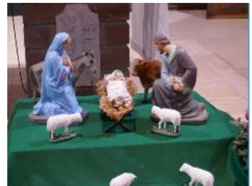
Crèche de Noël à l'église de Darney