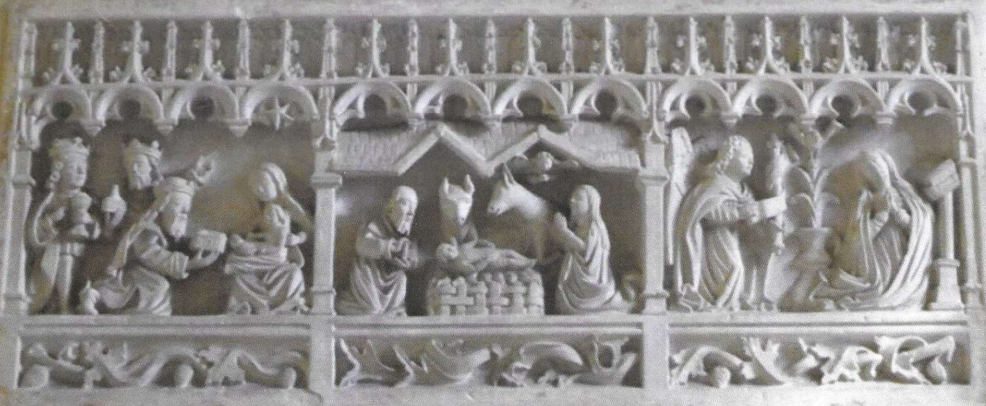
Rétable de Jainvilotte