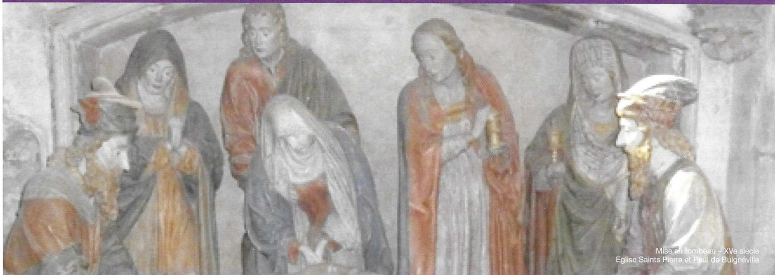
Mise au tombeau - XVe siècle Eglise Saints Pierre et Paul de Bulgnéville