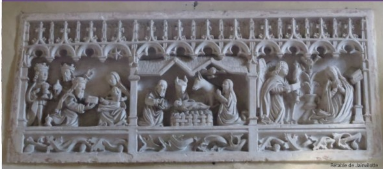
Rétablo de Jainvillotte