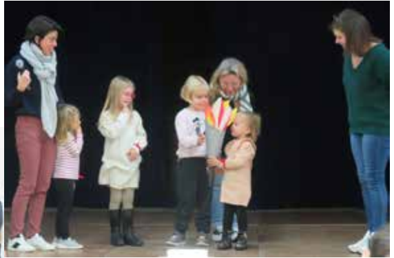
Passage de la flamme pour les petits comme pour les grands.

C'est dans une ambiance olympique que les enfants en ont repéré quelques-uns. Pour ce faire, ils ont relevé des défis, écouté, joué, chanté, prié. L'important était de participer et de s'entraider.