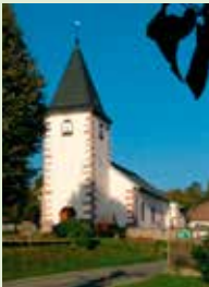
Le Haut du Tôt