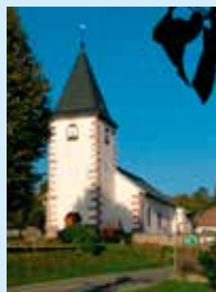
Le Haut du Tôt