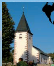
LE HAUT DU TÔT