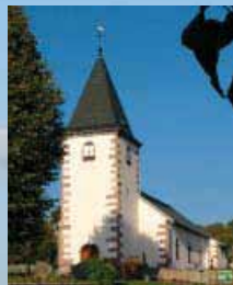
LE HAUT DU TÔT