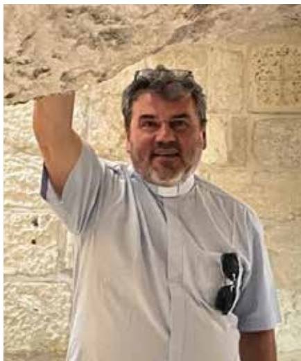
Bethléem octobre 2025

Noël, ce n'est pas dehors, mais dedans, Dans le feu doux d'une présence, Dans le regard qui console, Dans le pain qu'on partage. Noël, c'est la lumière qui s'avance, Et qui choisit une crèche au lieu d'un trône, Une étable au lieu d'un palais, Un silence au lieu d'un éclat. Noël, c'est Dieu qui murmure : Ne crains pas, je suis là ! Et l'homme qui répond : Enfin, je peux aimer.