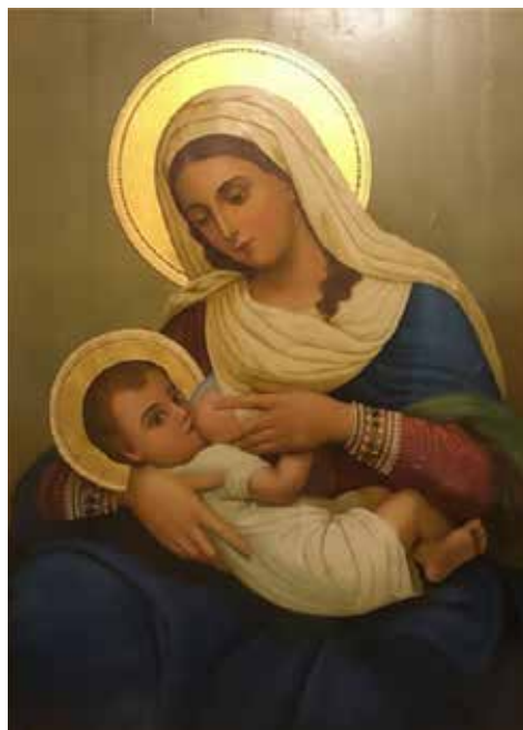
La Vierge et l'Enfant Grotte Notre-Dame du lait-Bethléem

Et François Mauriac ajoutait : Il n'y a pas de Noël sans une part d'enfance retrouvée. Parce qu'au fond, Noël nous rend à l'essentiel , à la pureté, à la confiance et à la simplicité de croire.