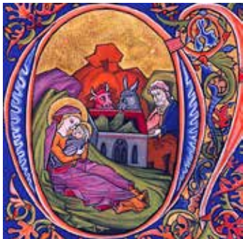
Nativité XIII e siècle - XIV e siècle