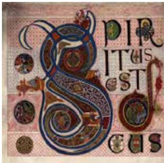
Spiritus es deus VIII e siècle