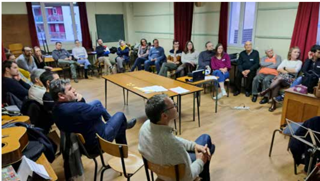
Le groupe des futurs mariés avec les accompagnateurs et les prêtres.

Ces sessions se dérouleront à La Source, salles du presbytère de Vagney.