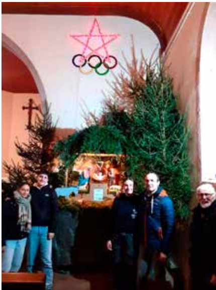
Crèche du Haut du Tô

Que ce soit au Haut du Tô avec la participation d'une partie de l'ensemble fuoco di Gioia ,