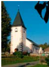
Le Haut du Tô