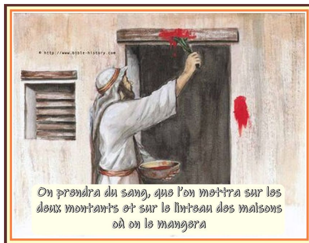
On prendra du sang, que l'on mettra sur les deux montants et sur le linteau des maisons où on le mangera

https://static.miraheze.org/christipediawiki/thumb/7/7d/Pesach_-_bloed_aan_deurposten.jpg/402px-Pesach_-_bloed_aan_deurposten.jpg