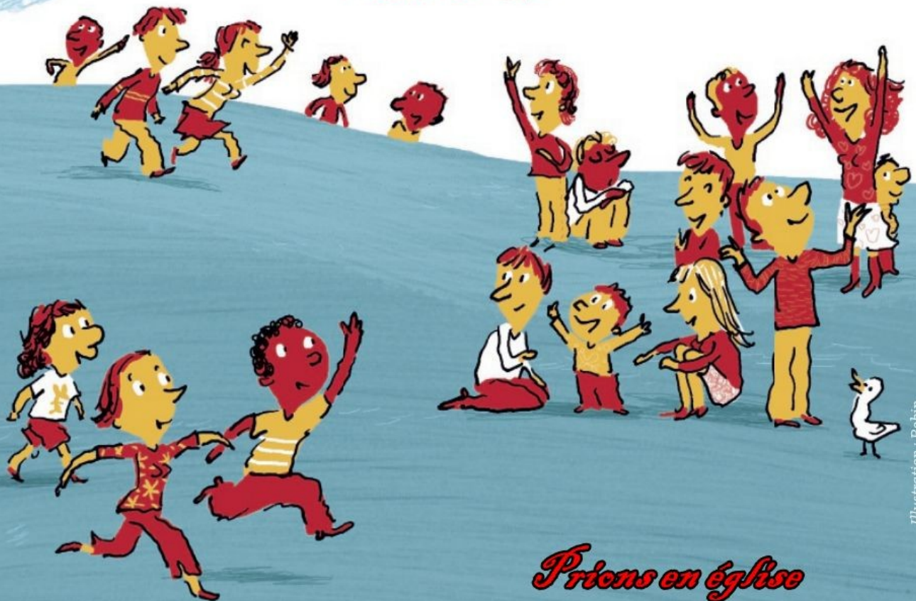
Illustration : Robin