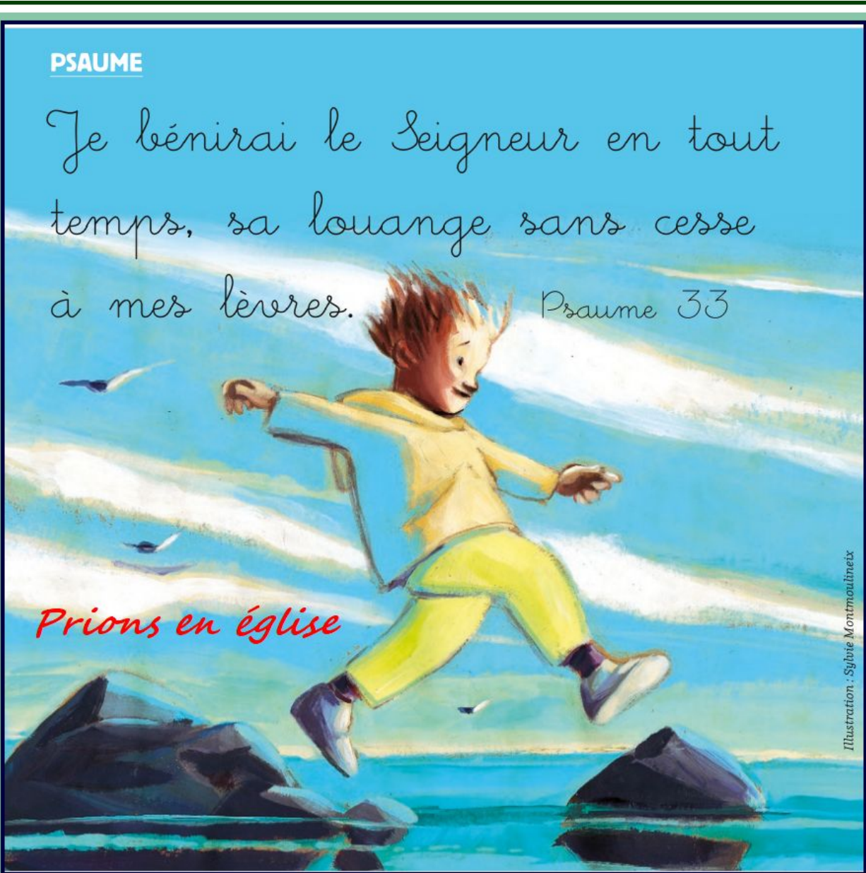
Illustration : Sybille Montmoulinet