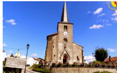
Eglise de GIRMONT

L'entrée en Carême, le MERCREDI DES CENDRES , aura lieu À l'église de GIRMONT, le 2 MARS 2022 à 18 h.