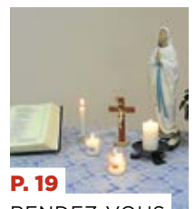
P. 19 RENDEZ-VOUS Récollecion des Équipes du Rosaire