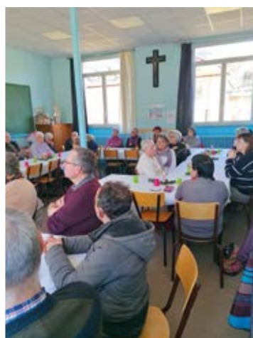
Cornimont : les bénévoles de la paroisse Notre-Dame-des-Gouttes se sont retrouvés le 18 janvier autour de la traditionnelle galette des Rois.