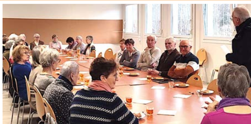
Saulxures : les bénévoles de la paroisse Sainte-Croix-du-Haut-du-Roc se sont retrouvés le 25 janvier pour la galette des Rois.