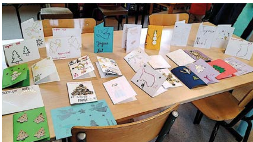
Le groupe de KT qui réunit les enfants de La Bresse, Cornimont et Ventron a réalisé des cartes de vœux destinées aux résidents du Couraège de Cornimont.