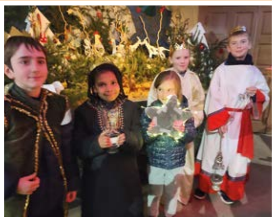
Thiéfosse : pour fêter l'Épiphanie, les enfants ont mimé l'évangile des Rois mages.