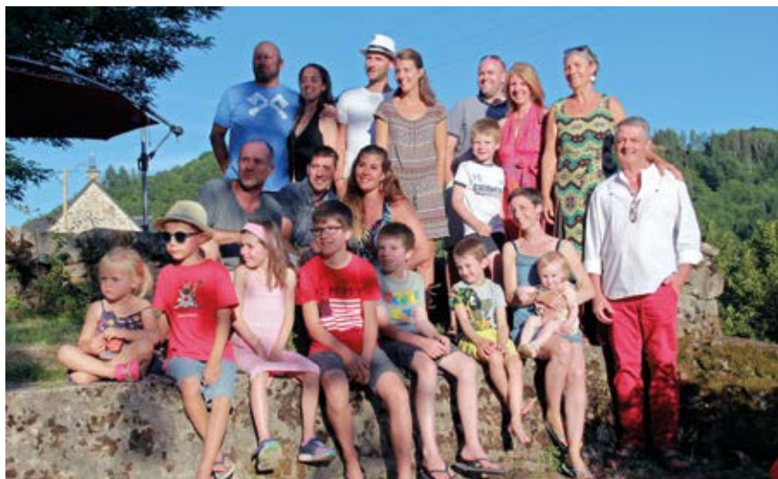
Dans le cadre du jubilé 2025, orienté vers l'espérance, porté sur la famille, nous voilà en marche.

Pour autant, quel que soit le contexte, la place de l'enfant dans la famille reste essentielle. L'arrivée d'un bébé chamboule inmanquablement la vie de l'entourage. Dans les fratries, certains aînés acceptent difficilement cette concurrence nouvelle. Pour les