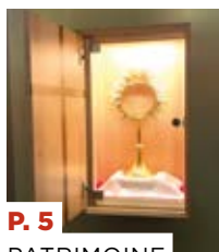
P. 5 PATRIMOINE Artisan au service de l'Église