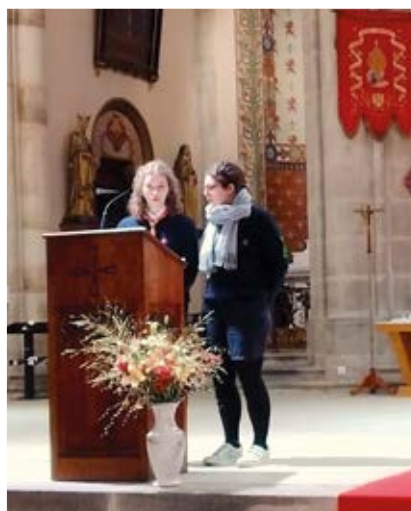
À l'église de Saulxures , les scouts de Metz ont animé la messe du baptême du Seigneur.