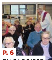
P. 6 EN PAROISSE J'étais malade et vous m'avez visité