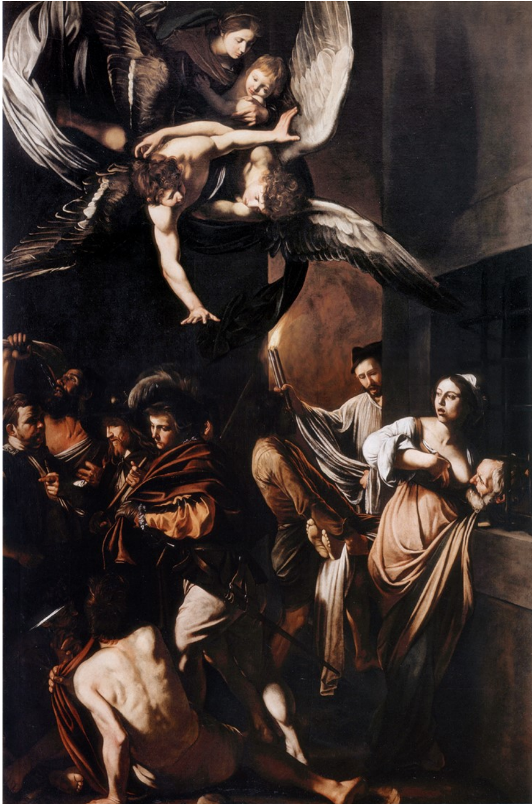
Les sept œuvres de miséricorde