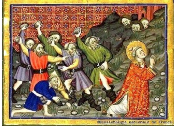
La Lapidation d'Etienne

Après la lapidation d'Etienne, les hellénistes sont chassés de Jérusalem. On les retrouvera à Antioche où ils prendront le nom de chrétiens et où ils s'ouvriront aux païens (11,19-26).