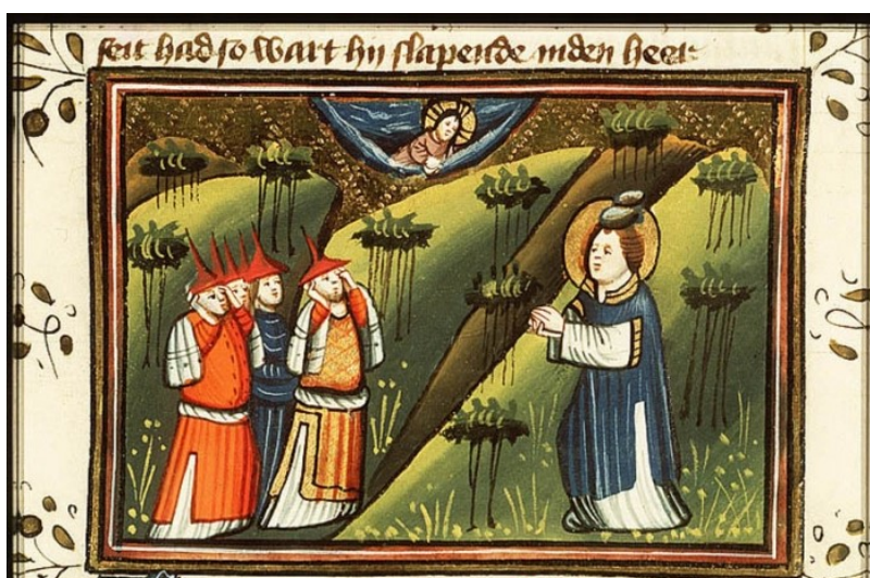
Bible d'Utrecht, Actes des apôtres, le discours de saint Étienne au sanhédrin, 15e siècle, Musée Meermanno, La Haye, Pays-Bas

Il critique une religion qui n'observe pas vraiment la Loi et qui est trop centrée sur un Temple fait de mains d'hommes.