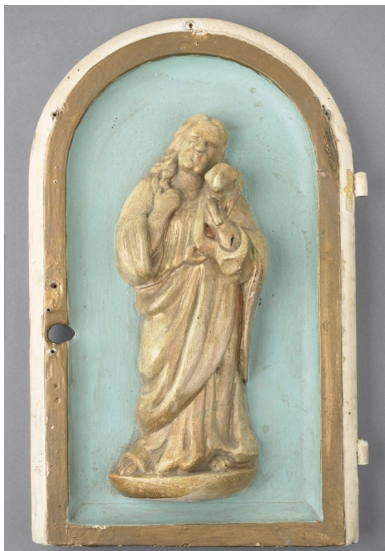
Le Bon Pasteur (porte de tabernacle) v. 1800 Musée des Beaux Arts Canada