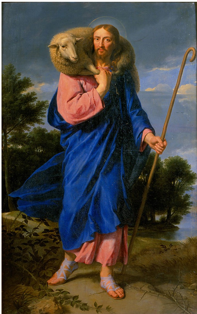
Philippe de Champaigne 1602-1674 1650 – 1660 Musée de tours