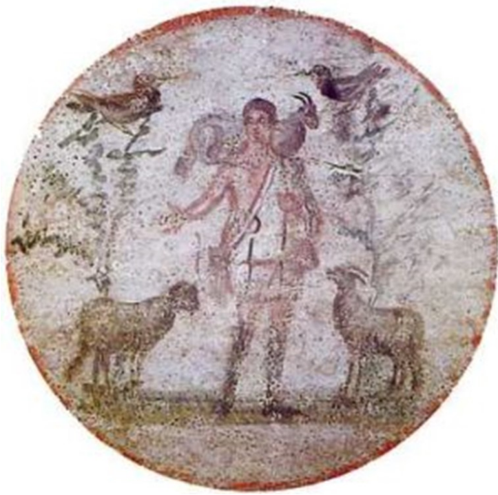
Fresque du bon-pasteur Catacombes sainte-Priscille Rome