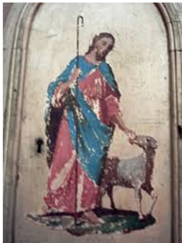
Ancienne porte de Tabernacle Eglise St Gérard Vitrolles