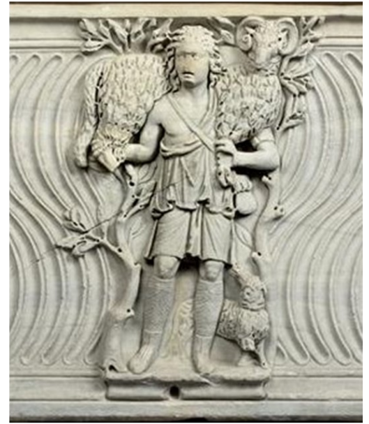
Sarcophage chrétien III e siècle Musée du Louvre