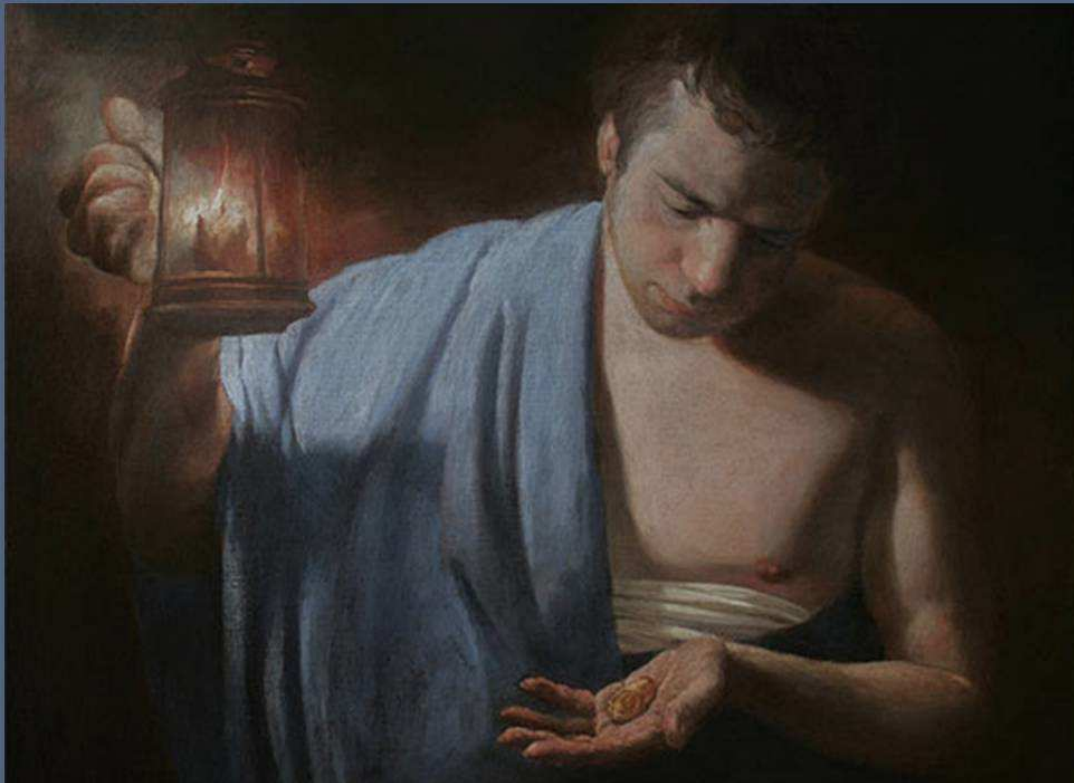
Andreï Mironov « La parabole des talents » (détail)